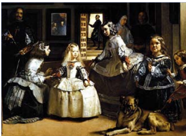
Figura 1. Las meninas de Velázquez

El contenido de la imagen es muy importante a la hora de anotarla para su posterior recuperación. Pero hay situaciones en las que la información visual no aporta todo el contenido de la propia imagen y es evidente que la combinación de la información visual con otra información textual, es beneficiosa para los sistemas de anotación (García-Serrano, 2011). Para lograr una mayor riqueza de anotación, destacamos una línea de investigación a la que cada vez se están dedicando más esfuerzos y será muy relevante en el futuro: la “contextualización de la imagen”. Generalmente, una imagen estará localizada dentro de una o varias webs que tratarán sobre temas relacionados con ella. De esta forma, la contextualización de la imagen analiza las propias webs, en vez de la imagen, y busca obtener un mayor conocimiento del contenido de la imagen además del que se pueda extraer de la misma. Por ejemplo, si se presenta en una web una imagen del cuadro de Las meninas , el sistema de procesamiento visual sabrá que hay un perro, un espejo, varias personas, incluso podría llegar a saber quiénes son las personas. Pero, del texto que rodea la imagen se puede extraer información sobre quién fue el autor, cuándo se pintó, pudiendo reconocer que se trata del cuadro original pintado por Velázquez o la reinterpretación de Picasso.