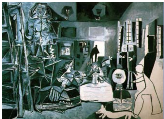
Figura 2. Las meninas de Picasso

Para lograr avanzar en este campo, numerosas comunidades de investigadores están creando bases de datos de imágenes comunes y públicas sobre las que cualquiera pueda realizar pruebas, de tal forma que sea posible establecer